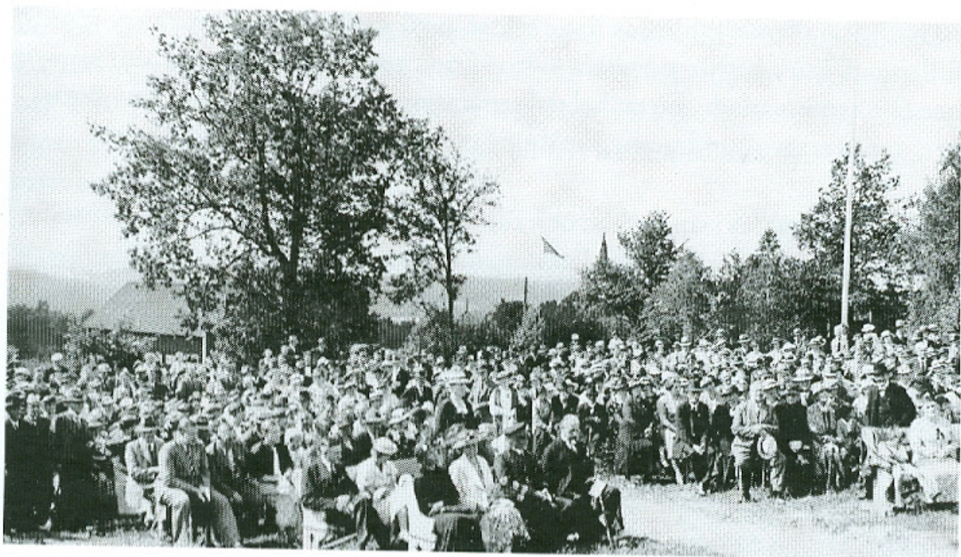
Hembygdsgårdens invigning 1937