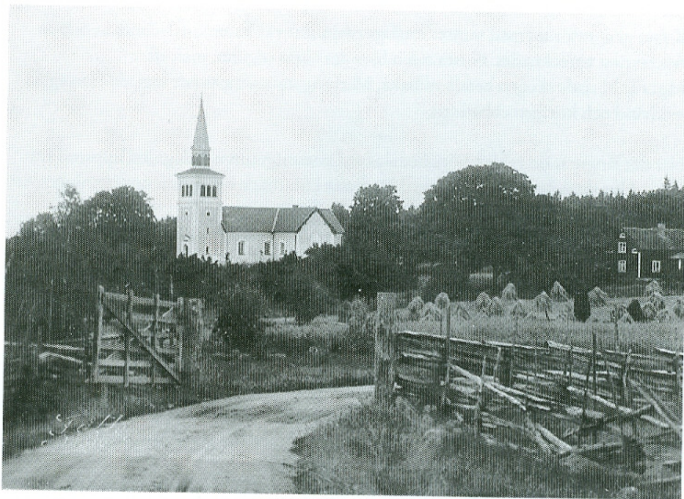
Marbäcks kyrka år 1921