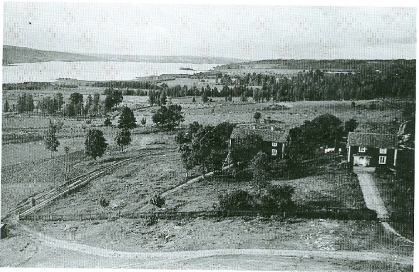
Utsikt över Ralången från kyrkan år 1926.