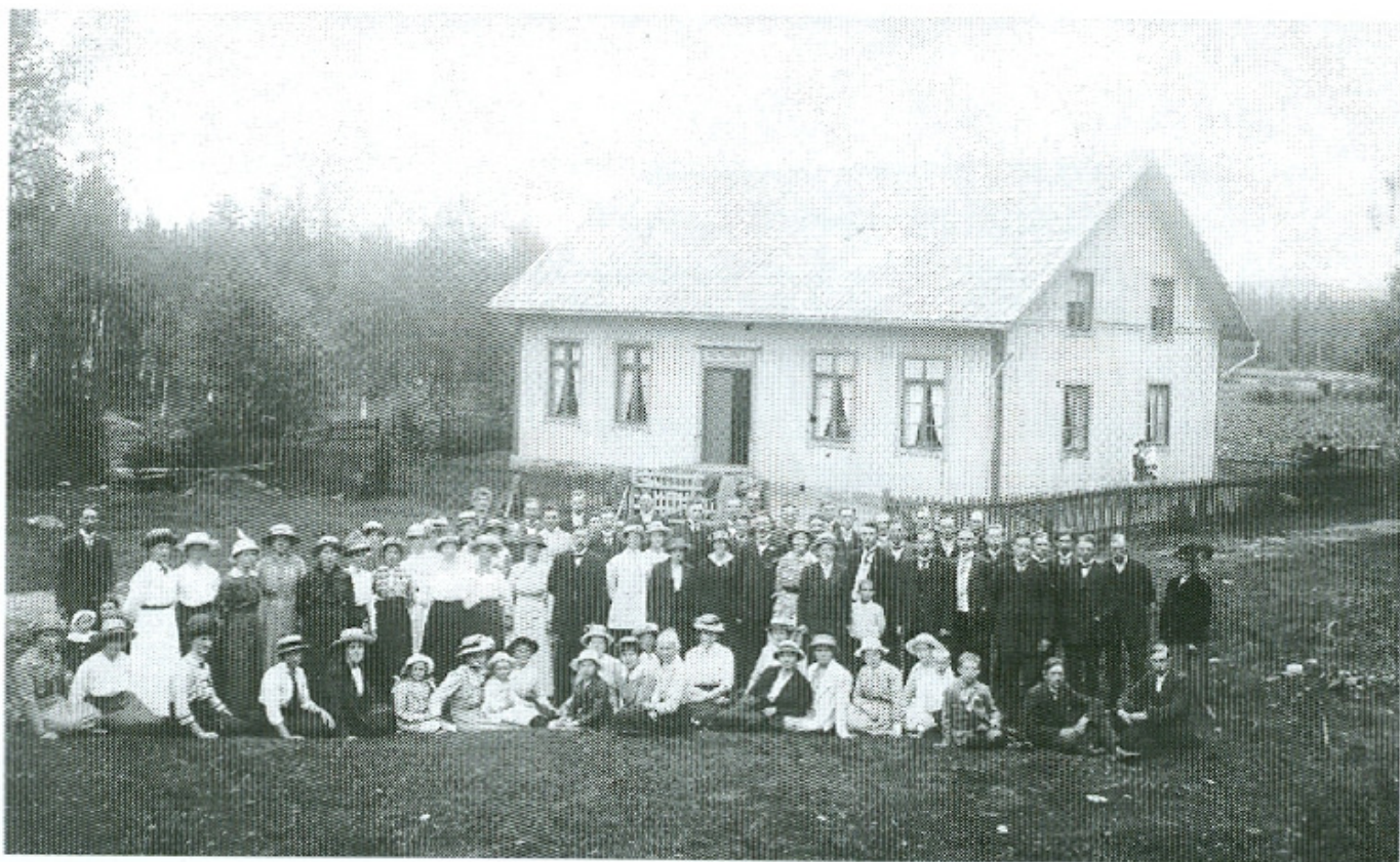
Betania Vallstorp i början av 1900-talet

Det är viktigt att vi värnar om vår hembygd och det är min önskan att alla, ung som gammal, ska känna sig riktigt hemma i Marbäcks hembygdsgård, en verklig pärla!